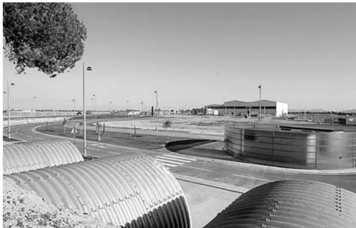
EXTERIORES. Vista parcial de las instalaciones.

dad, infraestructuras de última tecnología y está muy bien situado estratégicamente. Todo ello combinado con un diseño actual, muy moderno a la vez que bonito".