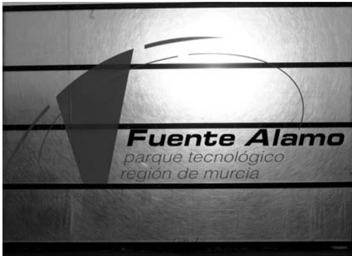
TECNOLOGÍA. Una imagen del nuevo Parque Tecnológico de Fuente Álamo.