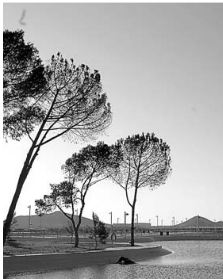
VERDE. El parque tiene amplias zonas ajardinadas.