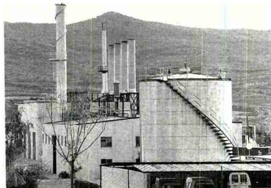
Planta de Viscofan, en Cáseda

Viscofan, con unos 4.000 trabajadores en el mundo (más de 800 en Navarra), es hoy día el único productor y distribuidor en el mundo de todas las familias de envolturas artificiales (con productos en celulósica, colágeno de pequeño y gran calibre, fibrosa y plásticos), fundamentalmente para la industria cárnica.