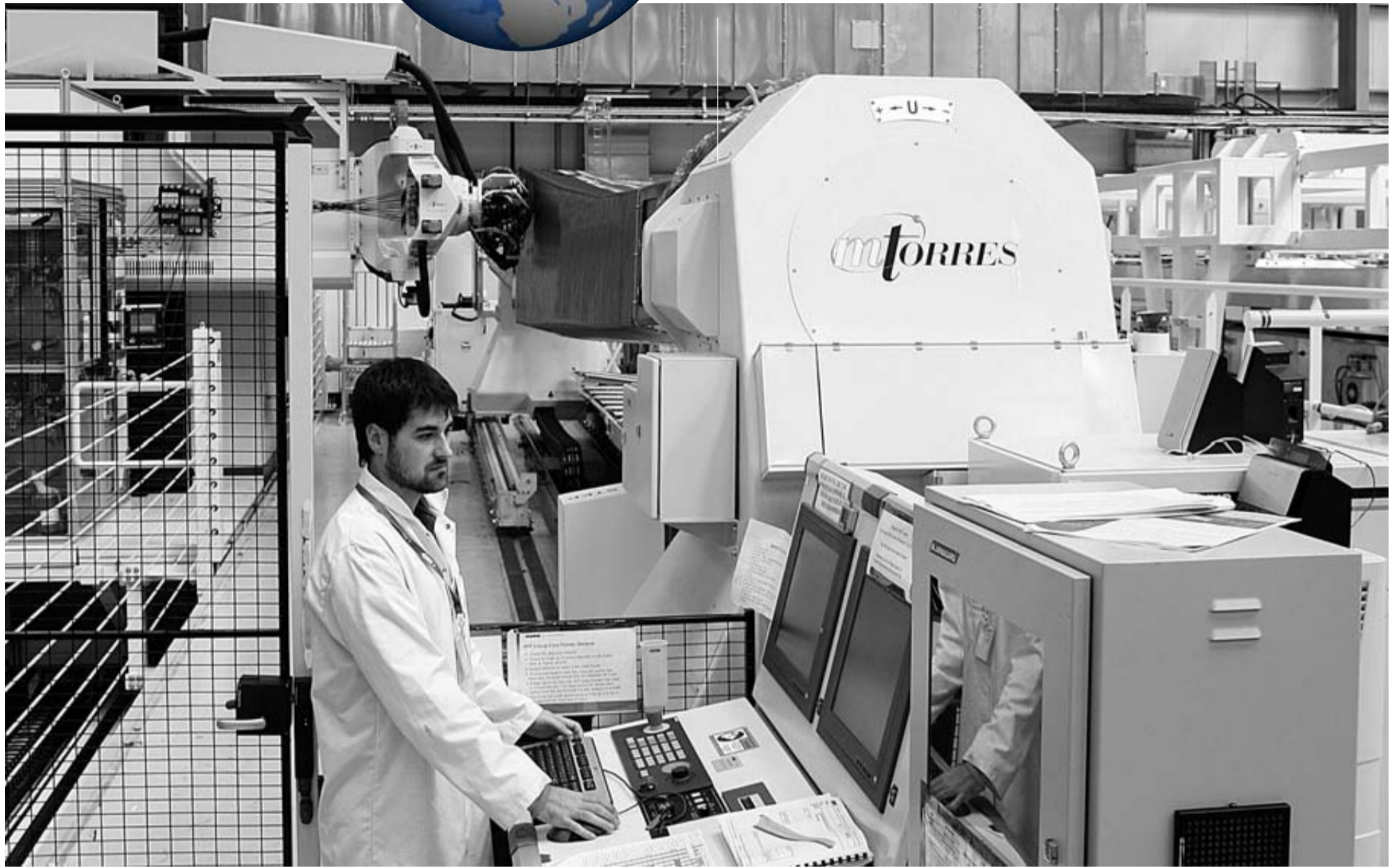
EN SU PUESTO DE TRABAJO. En la sala limpia de la fábrica, con una de las máquinas con las que GKN produce las piezas estructurales de las alas (spars) del proyecto Airbus A350.

cha actividad cultural y de ocio". Se dice que Bansky, uno de los artistas callejeros más célebres de la actualidad, y a la vez más desconocidos, porque no se conoce su identidad a ciencia cierta, nació en Bristol. De hecho, la ciudad cuenta con varias obras de este graffitero, que ha logrado colgar obras suyas en la Tate Modern de Londres o en el MOMA de Nueva York, y que ha conseguido que un episodio de Los Simpson de la temporada 22 le rinda homenaje.